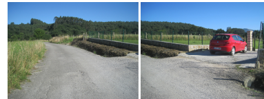
ACCESO A LA PARCELA