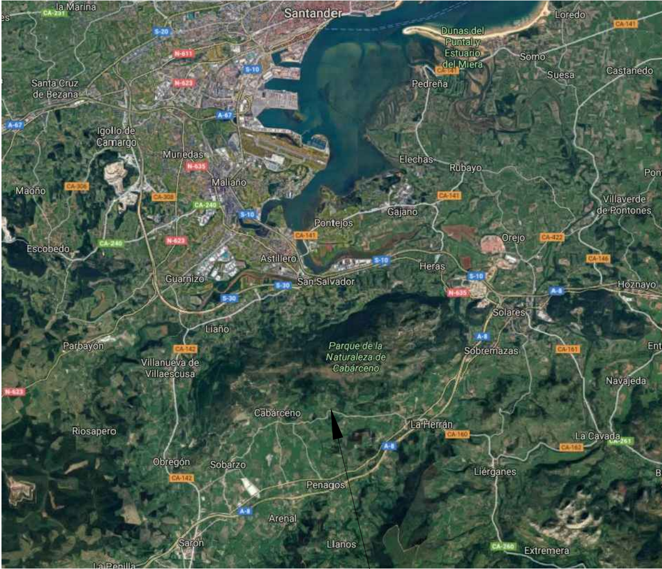
PARQUE DE LA NATURALEZA DE CABARCENO