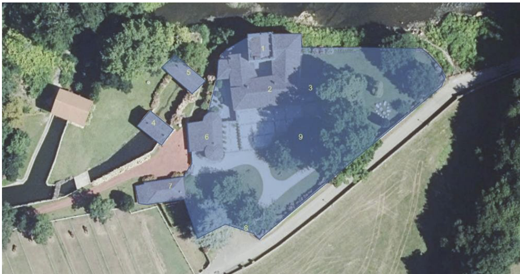
1. Torre Bustamante. 2. Palacio Bustamante. 3. Capilla. 4. Molino maquilero. 5. Molino. 6. Hornera. 7. Almacén. 8 Portalada

A continuación, se describe cada uno de los elementos que componen el bien ya declarado.