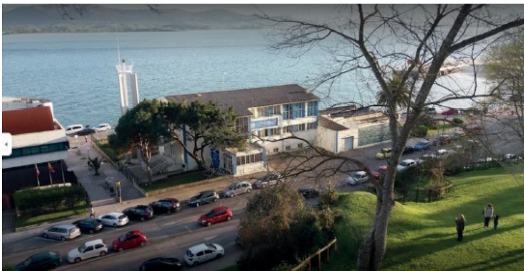
Centro de Formación Profesional Náutico Pesquera (Santander)

Además, se reitera que, dentro de los usos contemplados en el Plan de Puertos e Instalaciones Portuarias de Cantabria (artículo 21), se incluye el dotacional ("equipamientos y servicios públicos con objeto de proveer a los ciudadanos de servicios de educación..."), y dentro del mismo "Áreas Cubiertas: edificaciones o instalaciones educativas, deportivas y culturales, etc." y, conforme lo establecido en el artículo 39 "Distribución de los usos del Puerto de Laredo", este uso resulta un uso autorizable. Más aún, como ya se ha indicado anteriormente, considerando que este centro se destinará a la formación profesional náutico-pesquera, y a la vista de las titulaciones que la Dirección General de Formación Profesional y Educación Permanente manifiesta que se van a impartir, la edificación propuesta podría considerarse vinculada al uso pesquero, salvo mejor opinión fundada en derecho, y en ese caso se podría considerar que forma parte del uso pesquero tal y como lo define el artículo 21 del Plan de Puertos, y, de acuerdo con lo establecido en el artículo 39 del referido Plan, se trataría de un uso permitido para el área cubierta del puerto de Laredo, además de autorizable. Cabe recordar que el Plan de Puertos fue tramitado y aprobado de acuerdo con la legislación vigente, con la preceptiva información pública e institucional según el artículo 11 de la Ley de Puertos de Cantabria.