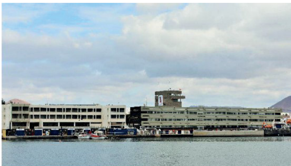
Instituto Politécnico de Formación Profesional Marítimo Pesquera de Canarias (Lanzarote)

En otros puertos se ha entendido esta necesidad, y por ello se han situado los centros de formación profesional náutico-pesquera lo más próximos posible a los muelles o dársenas del puerto, como se puede ver en los dos ejemplos cuya fotografía se reproduce a continuación.