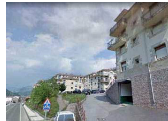
Bloques situados en la misma margen del SUNC-4

Como se puede comprobar, las alturas de los bloques situados junto al SUNC-4 es de baja+III+ bajocubierta, y tipología de manzana o bloque abierto muy definido.