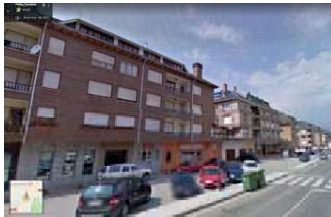
Bloques situados en la margen opuesta al SUNC-4

<MODIFICACIÓN PUNTUAL DEL PGOU DE POTES>