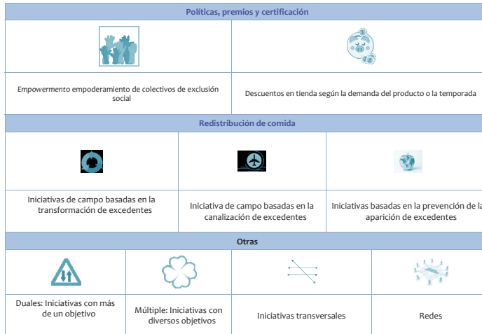
Figura E1.1. Clasificación de iniciativas contra el despilfarro de alimentos.